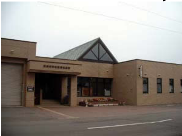
(保健福祉会館正面)