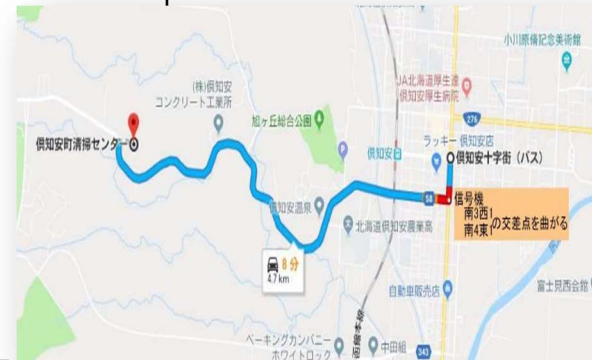
清掃センター地図